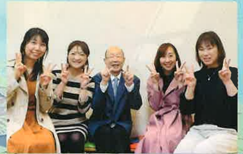
くらしき作陽大学卒業門下生と(2022)

1937年/大阪生まれ お茶の水女子大学附属小学校中学校卒業 1963-1968年/東京芸術大学附属音楽高等学校卒業 東京芸術大学音楽 学部器楽科卒業、同専攻科終了、最優秀賞【安宅賞】受賞 1995/ドイツ政府給費生 (DAAD)としてミュンヘン国立音楽大学留学 2005/ヨーロッパピアノ教育連盟【EPTA賞】受賞 2007/ハンガリー共和国文化勲章(Pro Cultura Hungarica)叙勲 1978-2007/くらしき作陽大学名誉教授 国際音楽コンクール(ジュネーヴ、ミュンヘン、ブゾーニ、ヴィオッ ティ、ブダペスト、セニガツリア、プレトリア、ポルト、エビナール、パ ルセロナ)審査員歴任