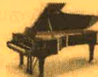
竹ホール スタインウェイ D274

マービーふれあいセンターのホールをあなただけの時間に… ホールならではの臨場感と、音の響きを体感してみませんか？ フルコンサートピアノを弾いてみたい方、グループでのピアノ発表会、 他の楽器との合奏など、どなたでも自由に演奏していただけます♪