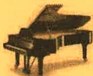
さつきホール ヤマハS6X

マービーふれあいセンターのホールをあなただけの時間に… ホールならではの臨場感と、音の響きを体感してみませんか？ フルコンサートピアノを弾いてみたい方、グループでのピアノ発表会、 他の楽器との合奏など、どなたでも自由に演奏していただけます♪