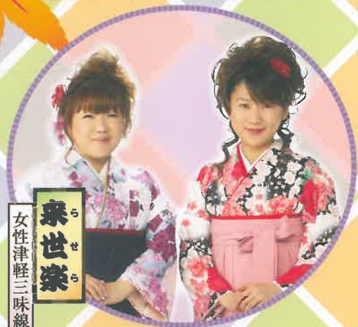
来世楽 女性津軽三味線ユニット

皆さまに愛されて、今回23回目を迎えた「アルスくらしき寄席」。 上方落語の定席・天満天神繁昌亭の雰囲気、倉敷にいながらにしてご堪能ください。