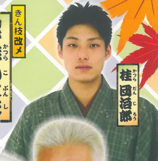
桂団治郎 かつら だんじろう