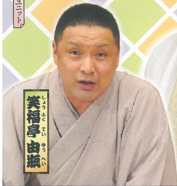
笑福亭由瓶 しょうふく亭 ゆうへい