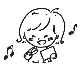
④ ペンたてをデコろう！