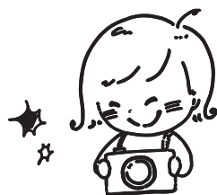
① 写真をパシャパシャ

★ 子どもチーム デジタル一眼レフカメラを使って倉敷美観地区で撮影をした後、フォトペンたてと倉敷フォトミュラルの応募作品を制作します。