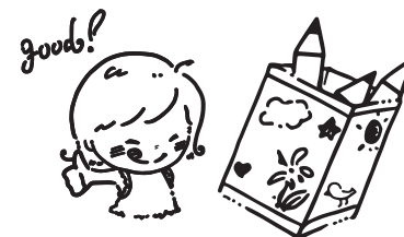
⑤ フォトペンたての完成！