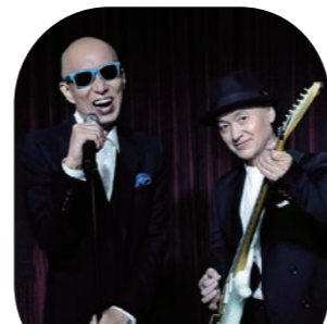
倉敷市芸文館 ホール

2,500円(当日500円増) ※3歳未満のお子様は膝上鑑賞無料。 ただし座席が必要な場合は要チケット。