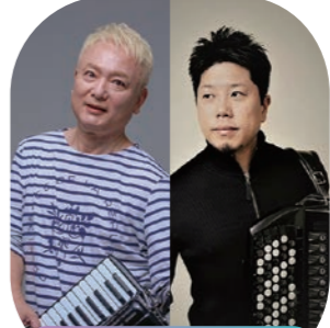
倉敷市芸文館 ホール

一般5,000円、大学生以下500円(当日各500円増) ※就学前のお子様のご入場はご遠慮ください