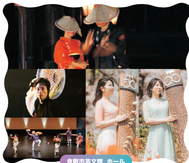
倉敷市芸文館 ホール