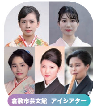
倉敷市芸文館 アイシアター

箏コンサート つるころりん 3.10 全席自由 【開場】17:30 【開演】18:00