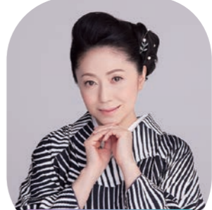
倉敷市芸文館 ホール

一般4,000円、大学生以下500円(当日各500円増) ※就学前のお子様のご入場はご遠慮ください