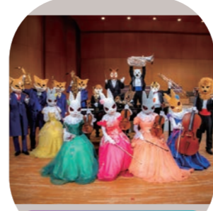
倉敷市芸文館 ホール

一般5,000円、大学生以下500円(当日各500円増) ※就学前のお子様のご入場はご遠慮ください