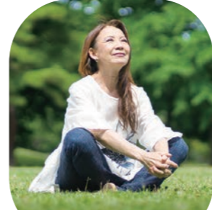
倉敷市芸文館 ホール

八神純子 キミの街へ 2025 ~Share the moment with you~