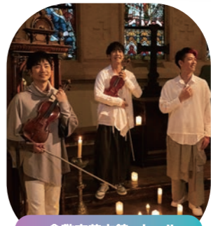
倉敷市芸文館 ホール

一般4,000円、大学生以下500円(当日各500円増) ※就学前のお子様のご入場はご遠慮ください