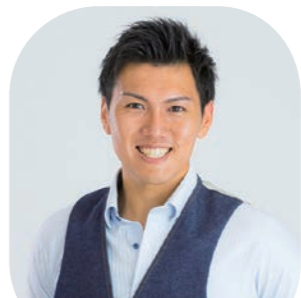
倉敷市芸文館 ホール

一般6,000円、大学生以下500円(当日各500円増) ※就学前のお子様のご入場はご遠慮ください